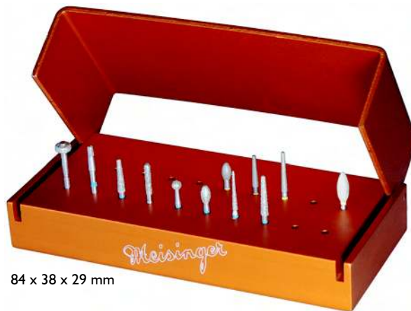
84 x 38 x 29 mm

Fresero básico para preparar coronas y puentes de óxido de circonio estabilizado con Yttrium (ZrO 2 ) en el área de dientes anteriores y posteriores. Este surtido se presta de forma excelente para las técnicas simples de preparación (sistemas 5- eje CAD/CAM) en la preparación clásica de hombro ó en la modificada preparación biselada.