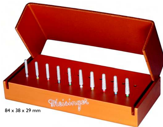
84 x 38 x 29 mm

Fresero para Cercon® de la técnica CAD/CAM. Para la técnica del microfresado paralelo se aplican los instrumentos con un ángulo de 0° y para el microfresado cónico con un ángulo de 2°.