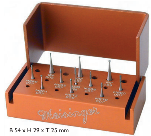
B 54 x H 29 x T 25 mm

En la micro medicina dental el juego Microdia ofrece la posibilidad de conservar la sustancia dental sana en un grado máximo durante la preparación. Los instrumentos diamantados del juego destacan por sus partes activas extremadamente reducidas y los cuellos de los instrumentos extraordinariamente delgados y tallados y, por esta razón, tienen una aptitud óptima para la técnica de preparación minimamente invasiva. La máxima precisión y el diamantado seleccionado hacen posible un trabajo definido con poca fuerza de compresión, en especial con preparaciones bajo el microscopio.